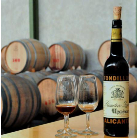
Wijncoöperatie Virgen del Pobre/Bodegas Xaló

(hoofdweg naar Alcalí) - rode Moscatel wijn - Fondillol